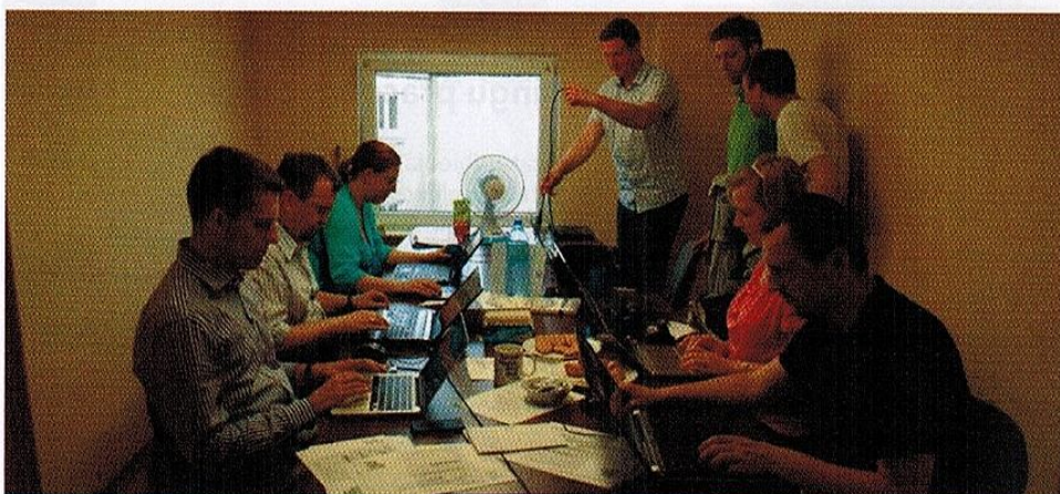
19 lipca 2013 r., Szczecińska Noc Antykorupcyjna, zorganizowana przez Stowarzyszenie Szczecinianie Decydują oraz Sieć Obywatelską Watchdog Polska. Uczestnicy wydarzenia na podstawie otrzymanych od Urzędu Miasta Szczecina skanów umów przygotowywały ich rejestr.

Sieć Obywatelska Watchdog Polska – prowadzi działania na rzecz jawności życia publicznego. Dostępność szerokiego zakresu informacji publicznej jest bardzo ważna dla wszystkich przedsiębiorców, w tym również tych z branż kreatywnych, innowacyjnych i wdrażających śmiałe projekty, ponieważ ich losy mogą być uzależnione od niejasnych decyzji urzędników